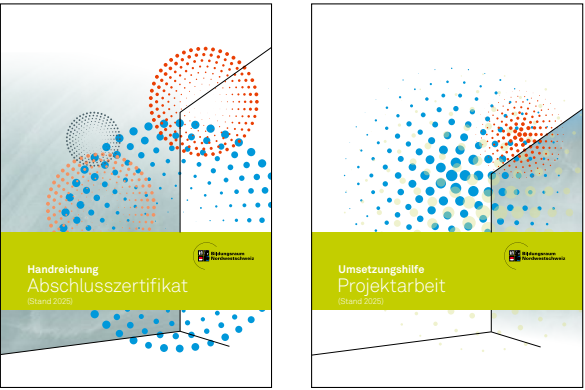
Handreichung Abschlusszertifikat und Umsetzungshilfe Projektarbeit